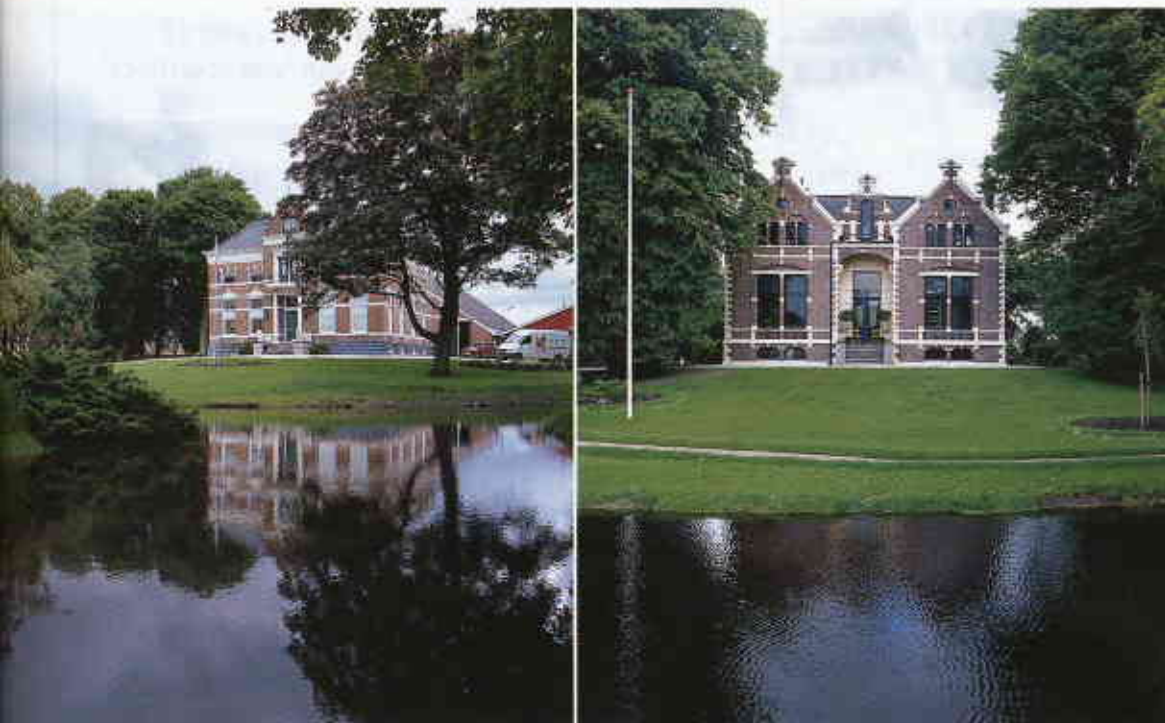
am. Deze naast elkaar gelegen slingeruinen zijn in de tweede helft van de 19e eeuw ontworpen door tuin- en landschaps-

Een overzichtsexpositie van de 'Boerenerven in het Oldambt' is te bezichtigen op 'De Boschplaatse' in Blijham, (0597) 56 12 03.